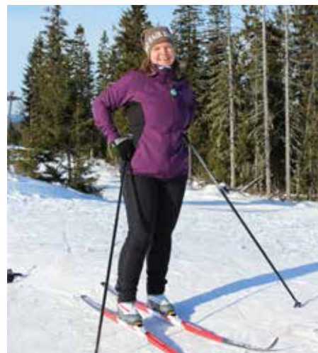
Åsa åker gärna skidor eller cyklar på fritiden