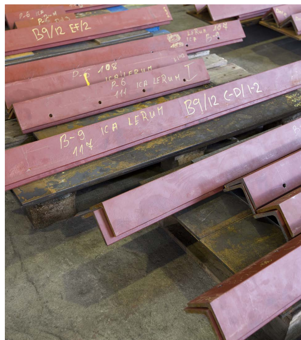
På golvet i den stora hallen på 2000 kvadratmeter ligger metall-delarna som så småningom ska bli till en stålhall för den nya "Drive in"-verksamheten på ICA Kvantum i Lerum.

Typiska uppdrag som LM Stålteknik AB jobbar med är tillverkning och montering av skeletten och stålstommar för till exempel industrifastigheter, skolor, bilhallar, matbutiker, kontorskomplex och idrottsbussar.