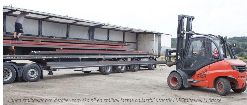
Länga stålbalkar och detaljer som ska bli en stålhall lastas på lastbil utanför LM Stålteknik i Lödöse.

– Ha, ha, Ja, jag har nog gjort det mesta, bland annat drivit ett café, jobbat som smed, jobbat på Volvo lastvagnar och jobbat på en liten mekanisk verkstad. Men det jag gör nu trivs jag väldigt bra med.