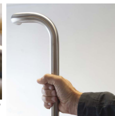
LM Beslag & Inredning designar, kapar, bockar och ytbehandlar alla sina dörrhandtag, räcken och olika tillbehör själva.