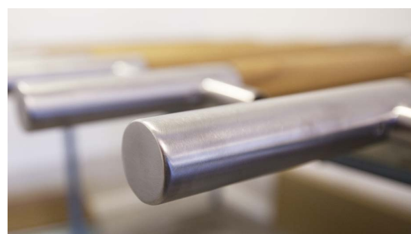
En leverans av färdiga dörrhandtag av borstat stål och polerad ek för användning till dörrar inom offentlig verksamhet.